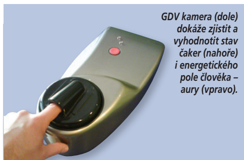
GDV kamera (dole) dokáže zjistit a vyhodnotit stav čaker (nahore) i energetického pole člověka – aury (vpravo).